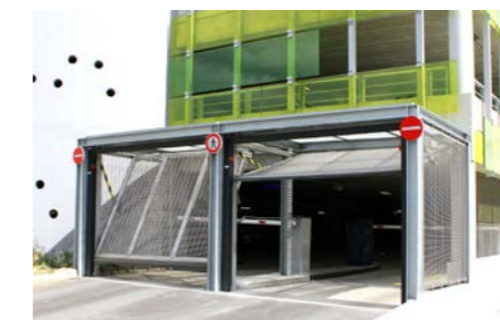
tablier avec grillage ou caillebotis