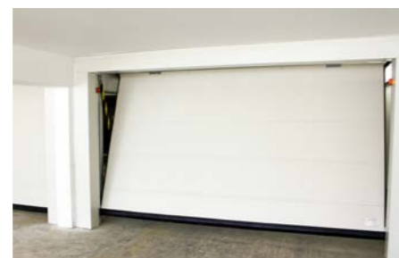
tablier avec panneaux isolants 40mm