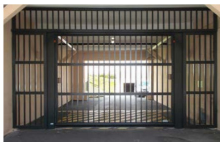
tablier en barreaux ronds, carrés ou losanges