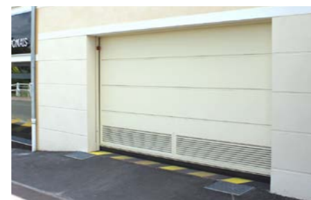
tablier avec tôles lisses ou tôles lisses joints creux