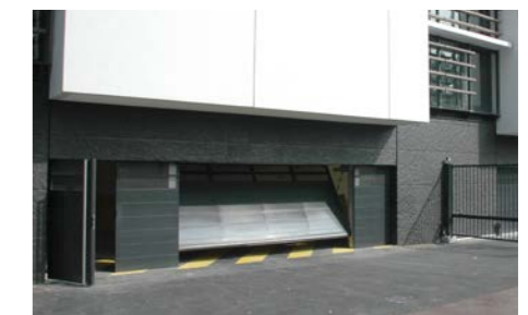
tablier avec tôles lisses pleines ou perforées