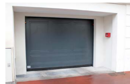
tablier avec remplissage bois